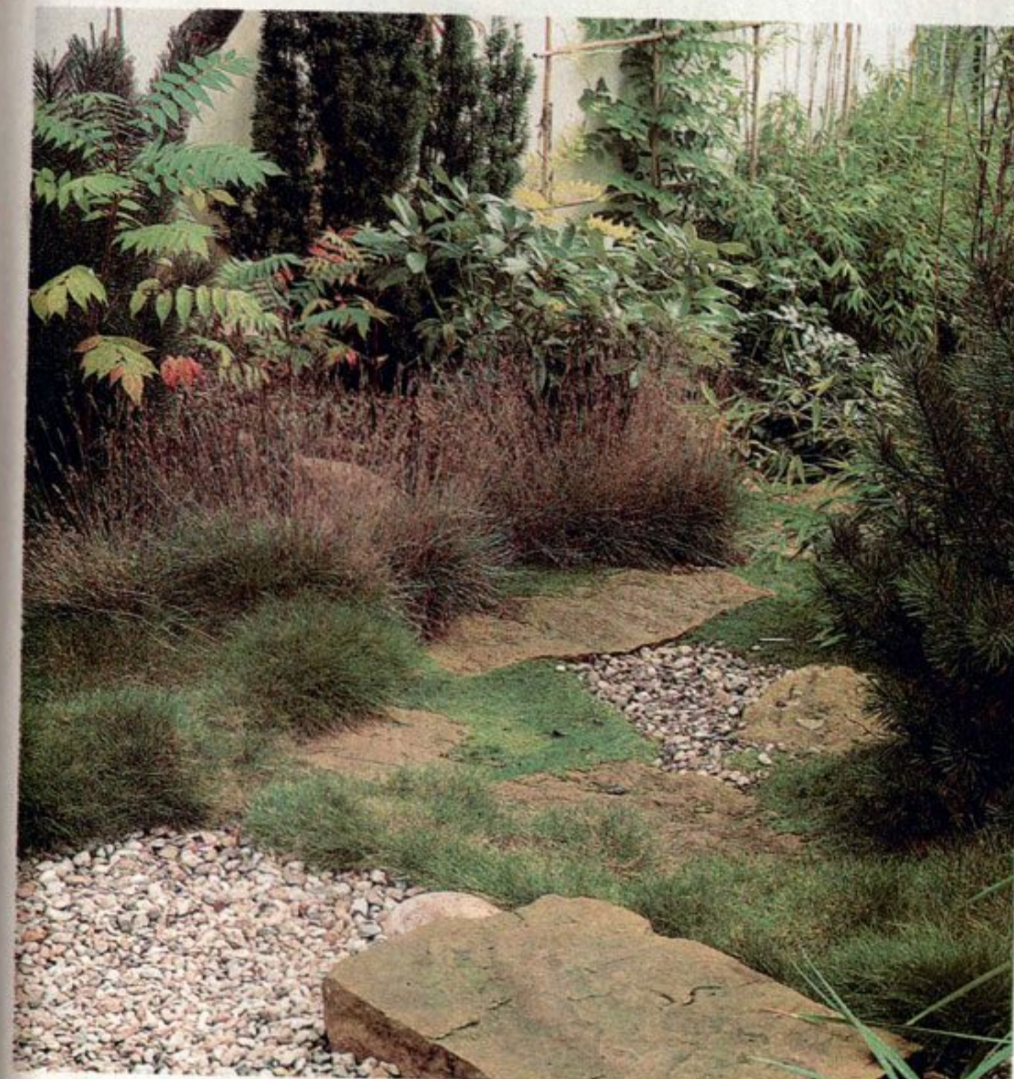
Pomiędzy kamieniami rośnie karmnik – roślina doskonale udająca mech, tak chętnie stosowany w ogrodach japońskich, jednak łatwiejsza w uprawie

bowiem patio od wiatrów, zimą zaś oddają swe ciepło, podwyższając o kilka stopni temperaturę ogrodowego powietrza. Pozwala to na posadzenie tutaj roślin słabo znoszących nasze chłody, lubiących wilgoć. Woda płynąca stale ze stawu i rozpryskująca się na kamieniach kaskady oraz regularne podlewanie i zraszanie roślin – nasyca powietrze wodą.